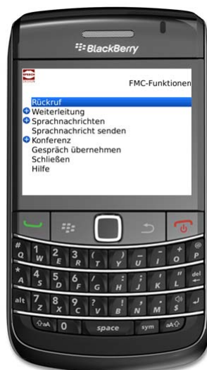
Bild 6: Bedienoberfläche für Funktionen im Ruhezustand bei BlackBerry.

Mit dieser Funktion wird die Dokumentation des FMC Mobility Client geöffnet.