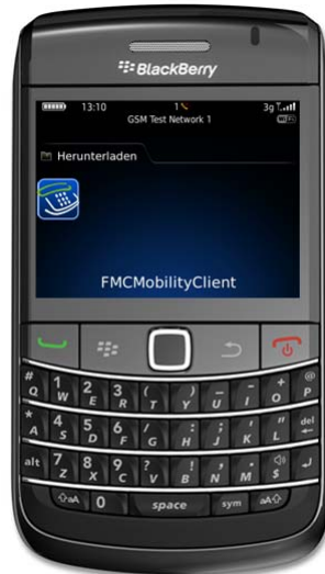
Bild 5: Symbol zum Erreichen der Funktionen im Ruhezustand bei BlackBerry.

Sie erreichen das Menü zum Steuern der Funktionen im Ruhezustand, indem Sie das Hauptprogramm durch Klicken auf das FMC Mobility Client Symbol starten. Dieses stellt ein Telefon dar. Der Hörer ist grün dargestellt, wenn der FMC Mobility Client aktiv ist. Ansonsten ist er rot dargestellt. Folgende Abbildung zeigt das Symbol, wenn der FMC Mobility Client aktiv ist: