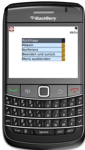
Bild 7: Bedienoberfläche für Funktionen im Gesprächszustand bei BlackBerry