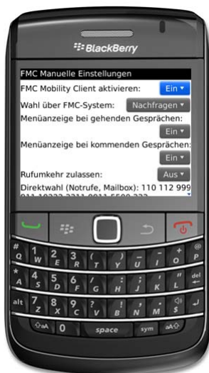
Bild 2: Bedienoberfläche für Manuelle Einstellungen bei BlackBerry.

Sie speichern die Werte durch Betätigen der Zurück -Taste und der Schaltfläche Speichern .